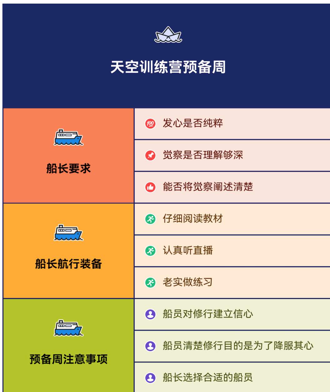
图 2.1: 预备周的重点