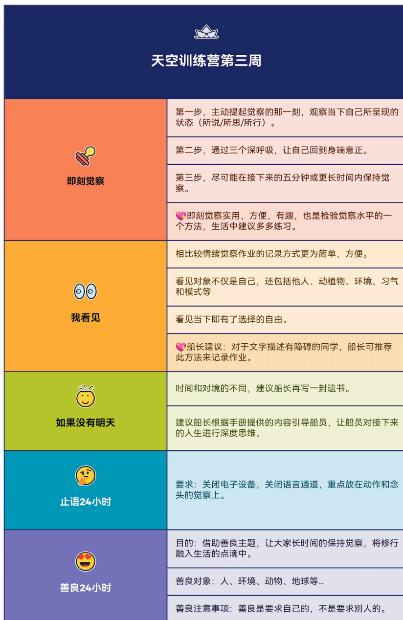
图 5.1: 第三周的重点