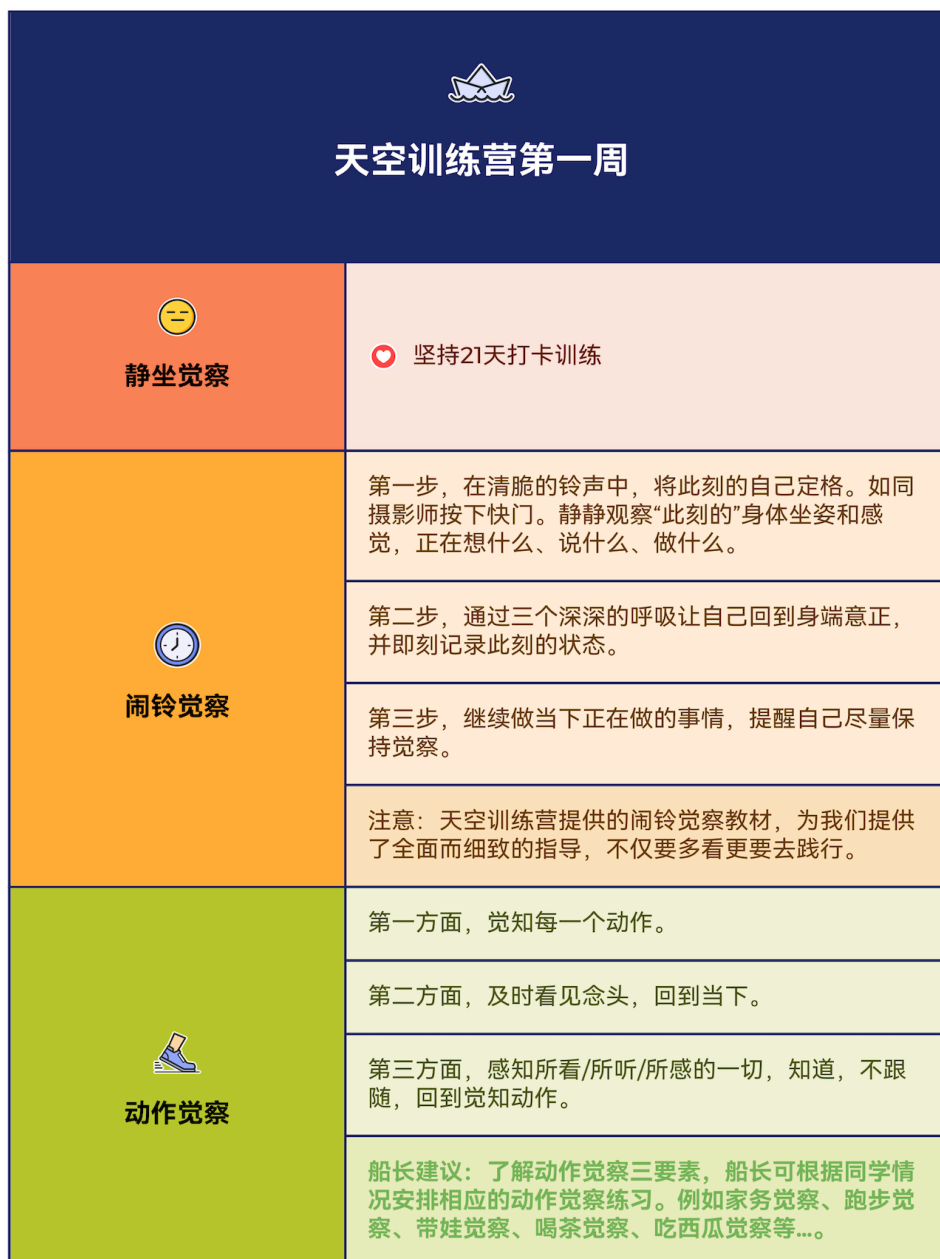
图 3.1: 第一周的重点