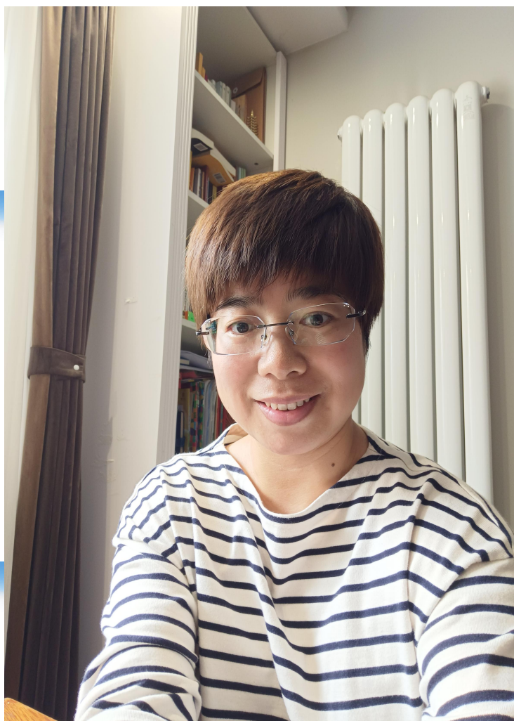
(10) 阅读《在生活中修行》感受